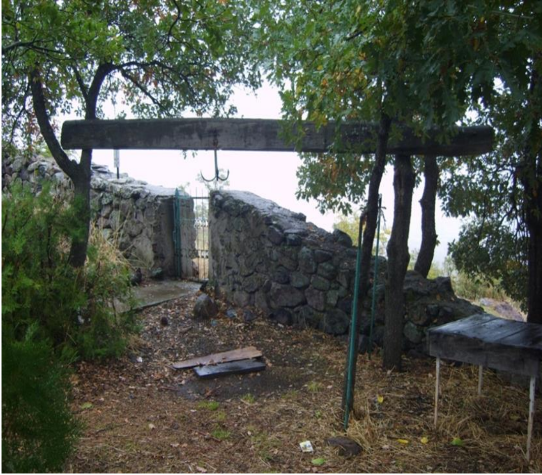
Kurban/adak kesim yeri