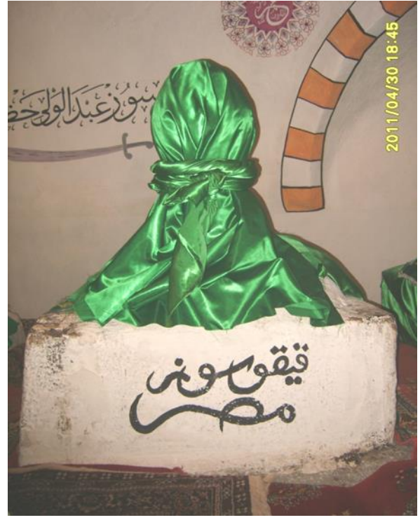
Kaygusuz Abdal'a ait olduğu söylenen ve üzerinde "Kaykusuz Mısır" yazan mezar