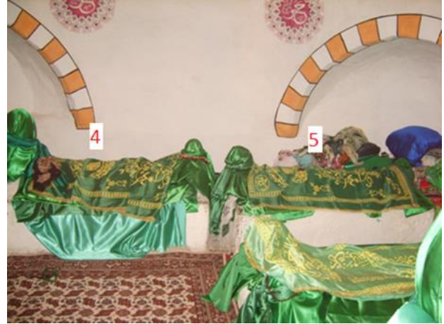
Kaygusuz Abdal ve dervişlerine ait olduğuna inanılan mezarlar. "1" rakamıyla gösterilen Kaygusuz Abdal'a, diğer dört mezarın ise dervişlerine ait olduğu söylenmektedir