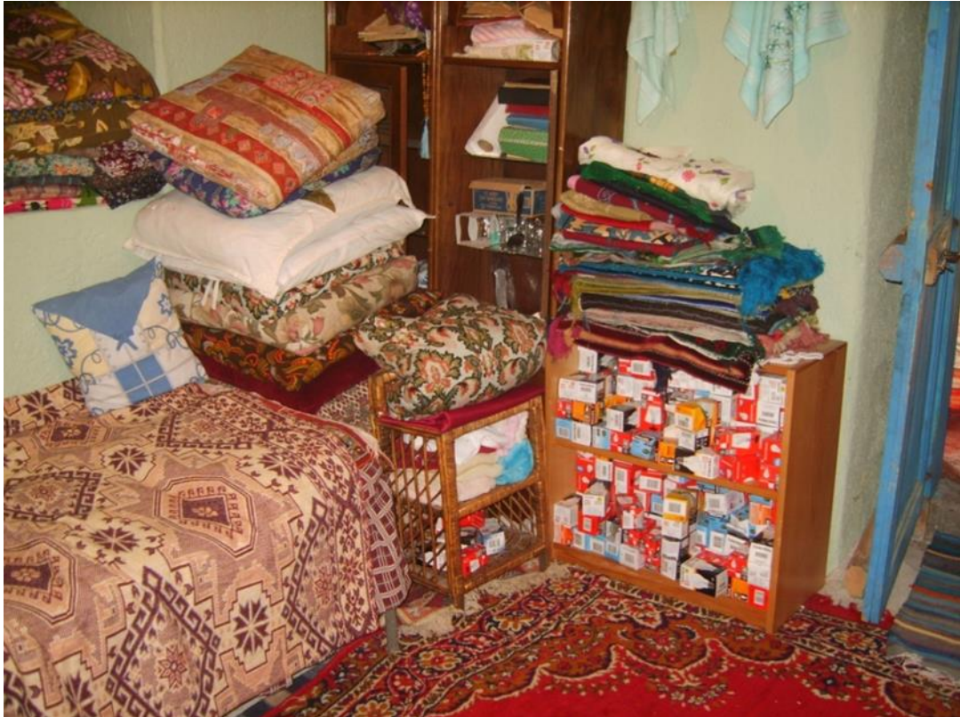
Ziyaretçiler tarafından türbeye getirilen eşya