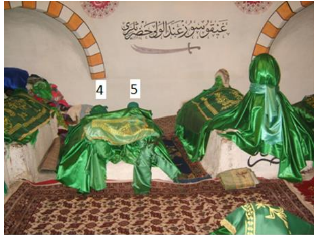
Türbe içinde yer alan ve Kabaca Köyü sakinlerinin dedelerine ait olduğu söylenen beş küçük mezar