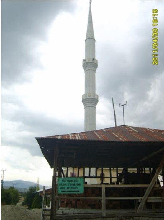
Kaygusuz Abdal Türbesinin Bahçe Kapısı