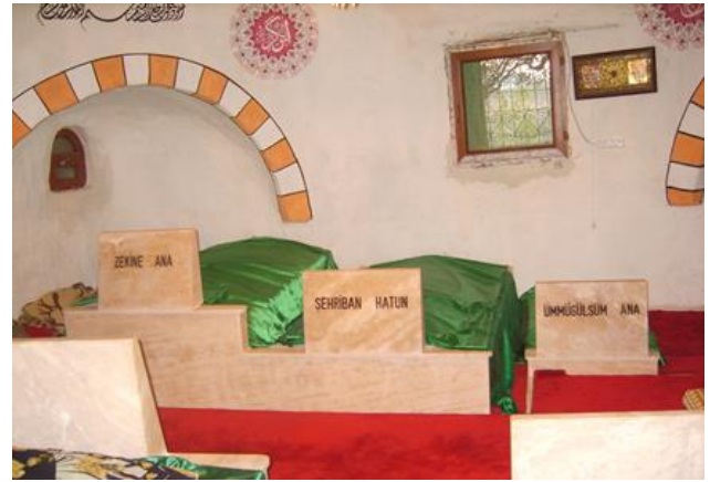
Son yıllarda Kabacalıların tepkisine yol açılan "tadilat"tan sonra türbenin iç görünüşü