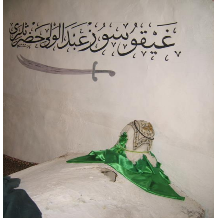
Kaygusuz Abdal'ın açılmış mezarı ve üzerinde Hz. Ali'nin kılıcı "Zülfikâr"ın temsili resmi. Resmin hemen üstünde Gaygusuz Abdal Veli Hazretleri yazısı yer alıyor