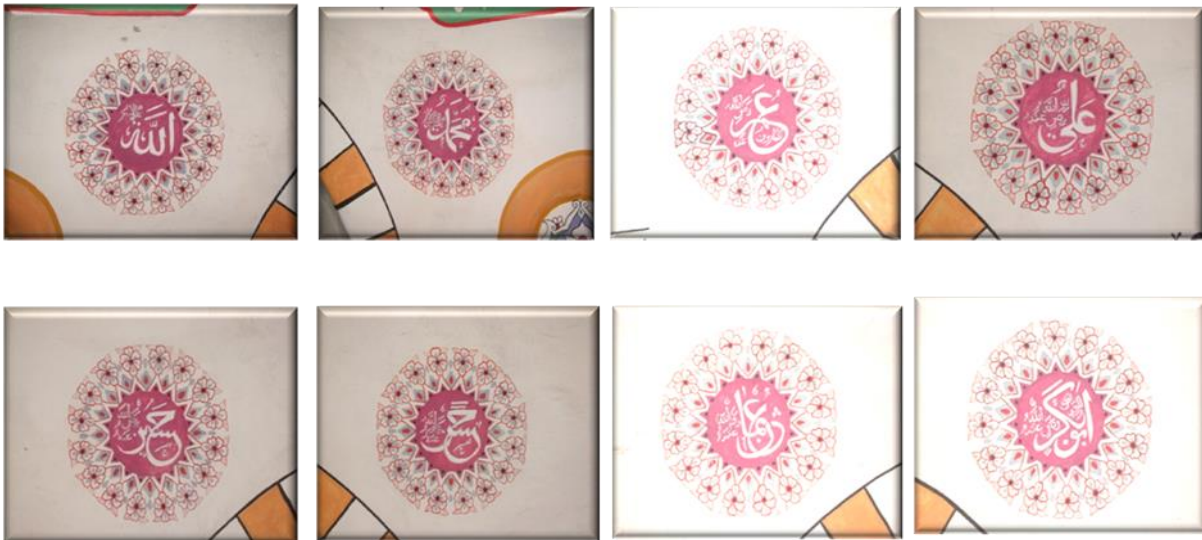
Duvarı madalyon içinde isimler: Allah, Muhammed, Ömer, Ali, Hüseyin, Hasan, Osman ve Ebubekir (Açık renk madalyonlarda Ömer, Osman ve Ebubekir isimleri yer alıyor)