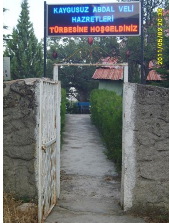
Kabaca Köyü Camii ve Kaygusuz Abdal Türbesi Levhası