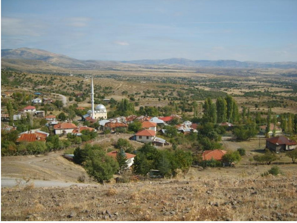
Kabaca Köyü Genel Görünüşü

kazandırmaktadır. Bunun da ötesinde bu türbe köyün ekonomisine önemli bir katkı sağlıyor görünmektedir. Son yıllarda tarımsal ve hayvansal olarak üretimin en aza indiği, birçok hanede sadece yaşlıların kaldığı, üretim karşılığı olarak herhangi bir parasal girdinin olmadığı bu köyde, köylülere önemli bir ekonomik girdi (et/gıda) sağlamaktadır. Türbede kesilen adak bazen haftada, bazen birkaç haftada bir hanelere sırasıyla dağıtılmakta böylece önemli bir besin ihtiyacı karşılanmış olmaktadır. Ancak elbette türbeyi bu “girdi”ye sınırlamak doğru değildir. Kaygusuz Abdal Türbesi, Kabaca’da anlatılan rivayetiyle, hem köylüler hem de ziyaretçiler üzerindeki önemli bir manevi etkiye de sahiptir.